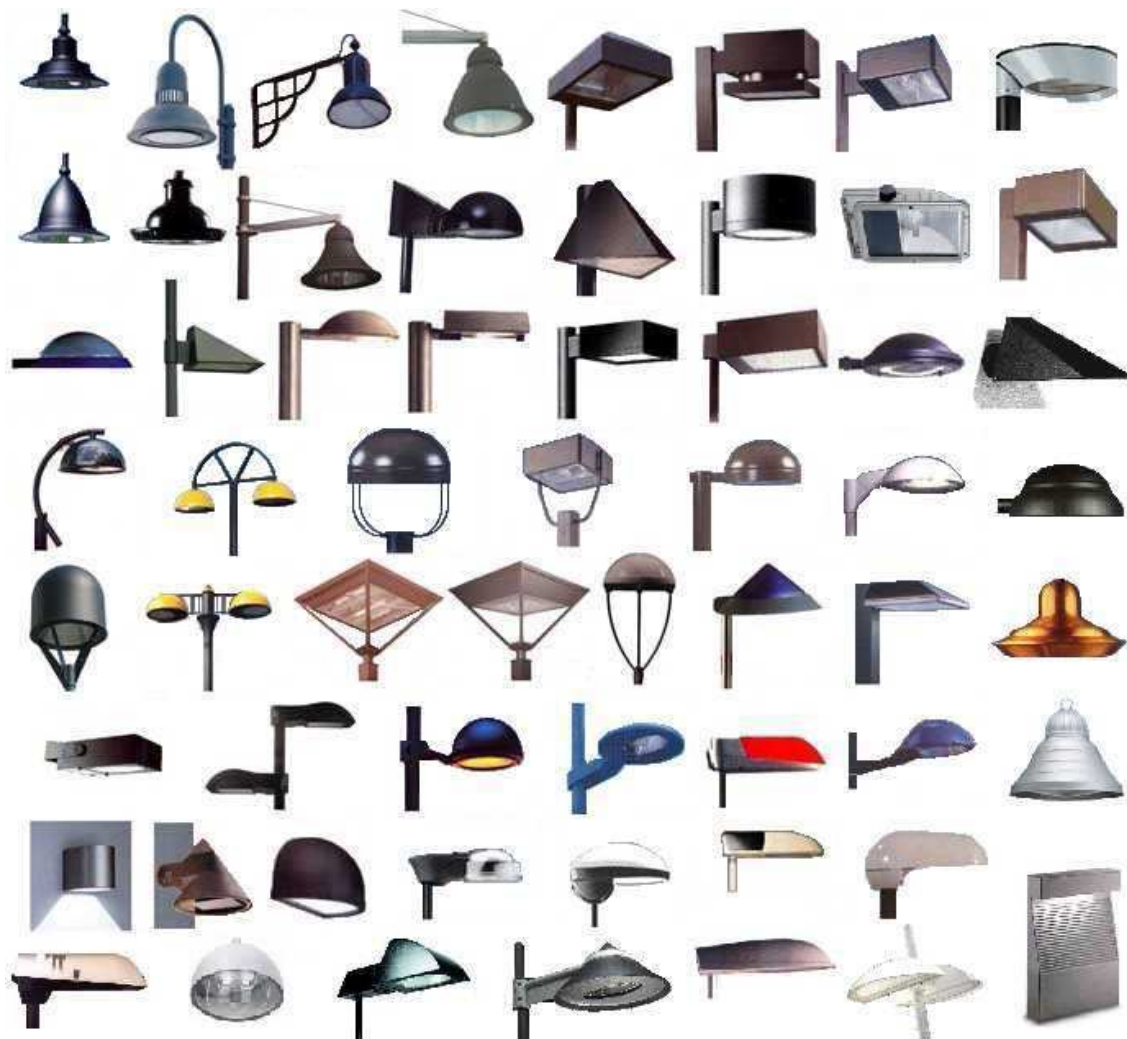
figura 1 - Esempi di prodotti cut-off da utilizzare per l'illuminazione di strade, parcheggi, zone residenziali, ecc.