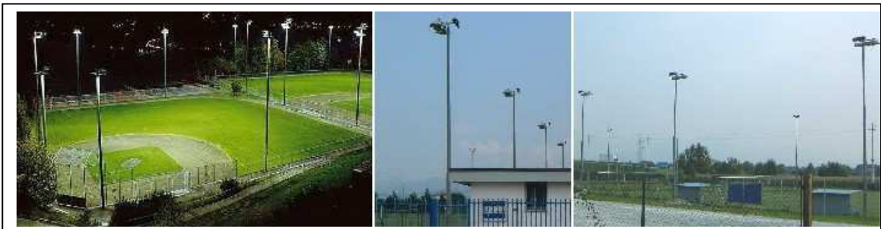
Figura 3 - Esempi di corretta illuminazione di impianti sportivi

1. L'obbligo di lampade al sodio non è previsto per gli impianti sportivi e in tutti i casi in cui è assolutamente necessaria la corretta percezione dei colori. In ogni caso dovranno essere impiegati criteri e mezzi per evitare fenomeni di dispersione della luce verso l'alto e al di fuori di suddetti impianti. Ad esempio, nel caso specifico degli impianti sportivi, in molti casi può essere determinante al fine di contenere l'inquinamento luminoso e l'abbagliamento rivedere l'inclinazione dei proiettori in modo da assicurare livelli di emissione massima in linea con quanto previsto per l'illuminazione di grandi aree; inoltre possono essere installati nella parte superiore dei proiettori appositi schermi metallici atti a contenere la dispersione verso l'alto.