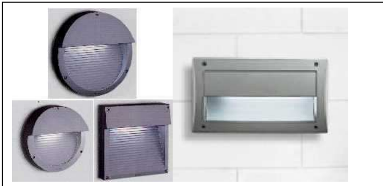
Figura 6 - ottimi apparecchi completamente schermati da utilizzare per percorsi interni, segna passo ed illuminazione residenziale in genere

Gli impianti esistenti, non conformi a tali caratteristiche tecniche e non rientranti nelle deroghe sopra descritte si adeguano con procedure anche a basso costo alle indicazioni tecniche riferite per detto genere di ottica. Dopo la procedura di adeguamento la dispersione massima non può essere superiore al 3% come stabilito dall'allegato A della L.R. 39/2005.