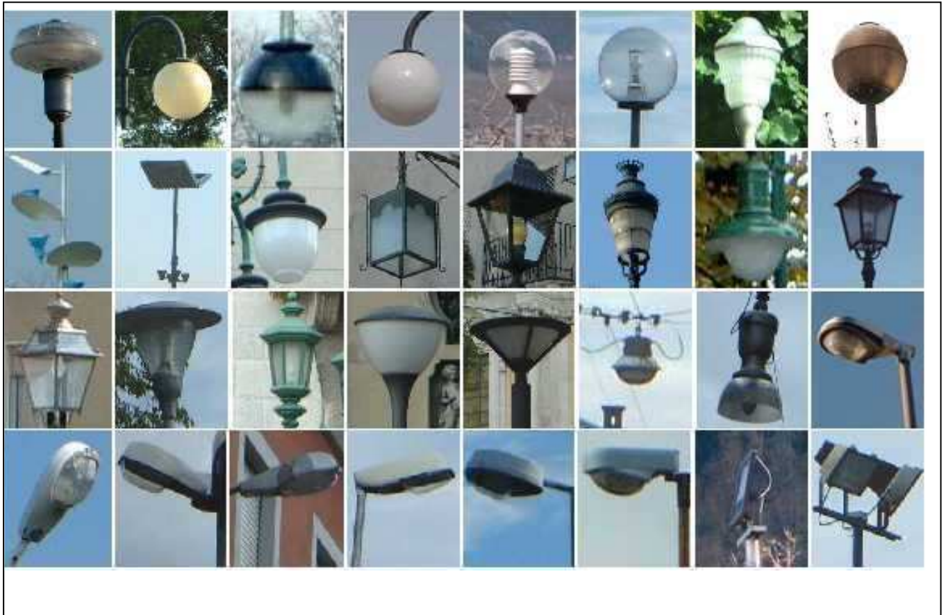
Figura 2 - Esempi di corpi illuminanti obsoleti ed inquinanti non rispondenti ai criteri indicati dal presente regolamento. Non utilizzare questi prodotti per nuove installazioni